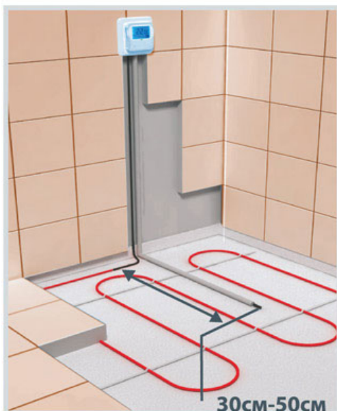
Схема укладки датчика температуры в гофрированной трубке