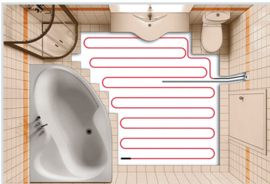
Схема укладки кабеля на свободную площадь